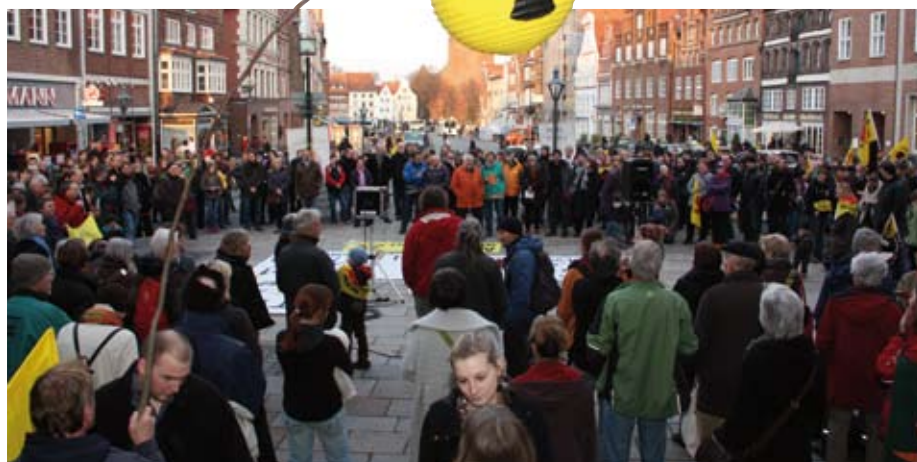
Mahnwache in Lüneburg

Mahnwachen und jede Menge andere Aktionen für einen sofortigen Atomausstieg