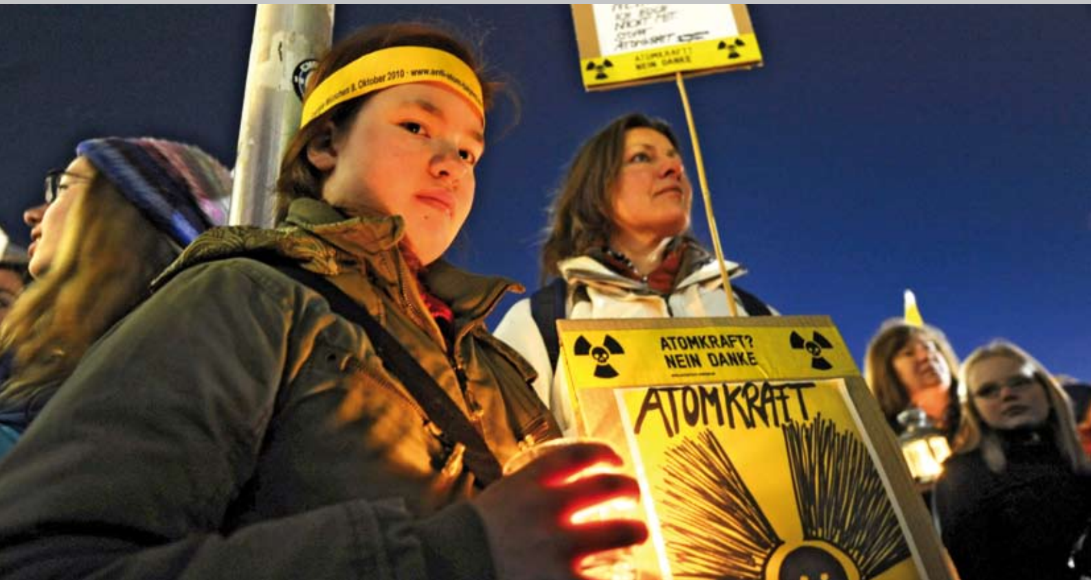
Fünf von 146.000 Menschen: Mahnwache "Fukushima ist überall" in München am 21. März