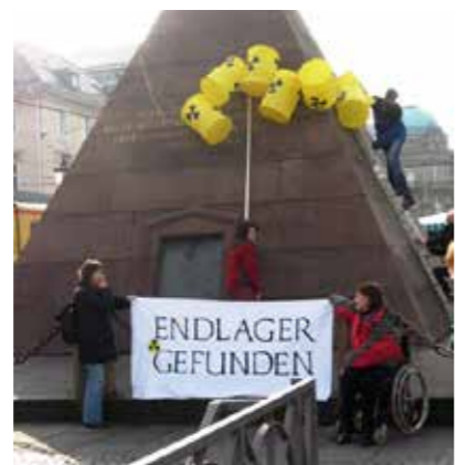
Atommüll-Aktion am Karlsruher Wahrzeichen, der Pyramide

Der Aufruf zur Aktionswoche im .ausgestrahlt-Rundbrief 2/2008 kam sehr kurzfristig. Trotzdem waren Ende Oktober in etwa zehn Städten kleine und größere Gruppen aktiv, nutzten das bereit gestellte Material und brachten „Atommüll-Behälter“ in Fußgängerzonen und öffentliche Verkehrsmittel, klärten über das ungelöste Problem mit radioaktiven Abfällen auf und informierten über den bevorstehenden Castor-Transport nach Gorleben.