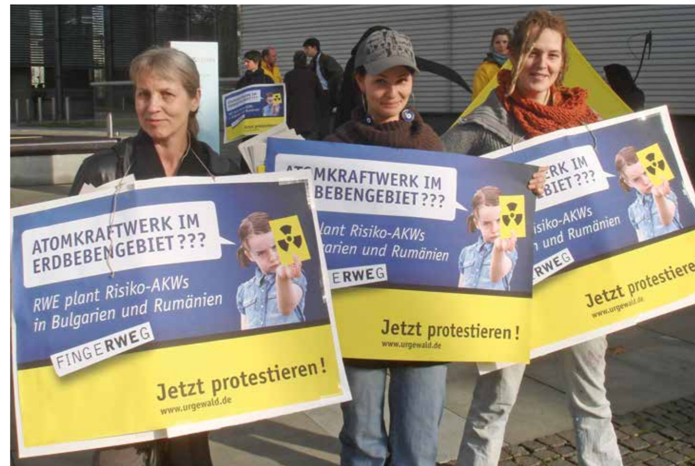
Proteste vor der RWE-Aufsichtsratsitzung am 2.11.2008 in Essen

Unser Ziel: RWE soll sich gegen die Finanzierung des Kraftwerks entscheiden.