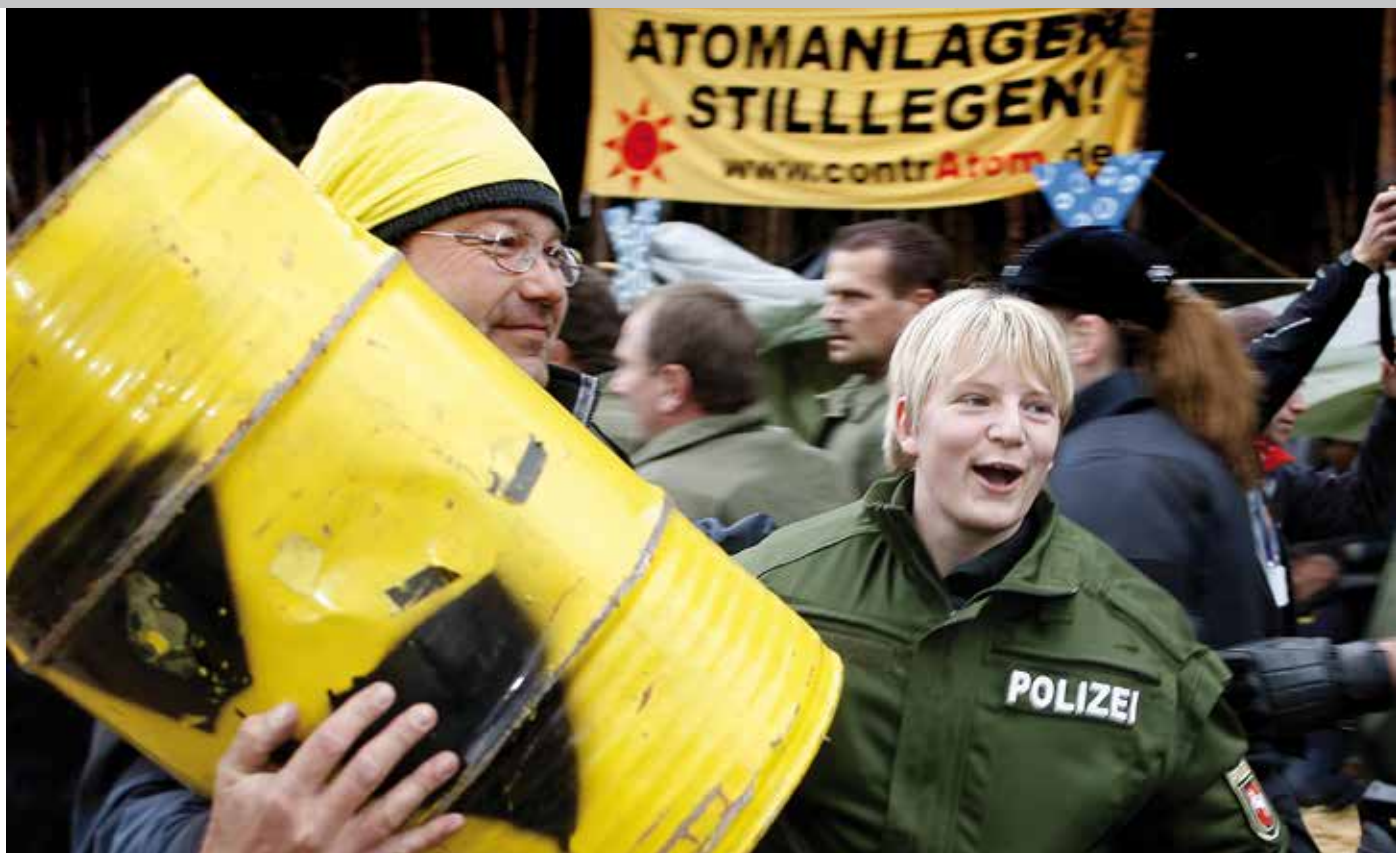
Gorleben, November 2008 (mehr auf Seite 8/9)