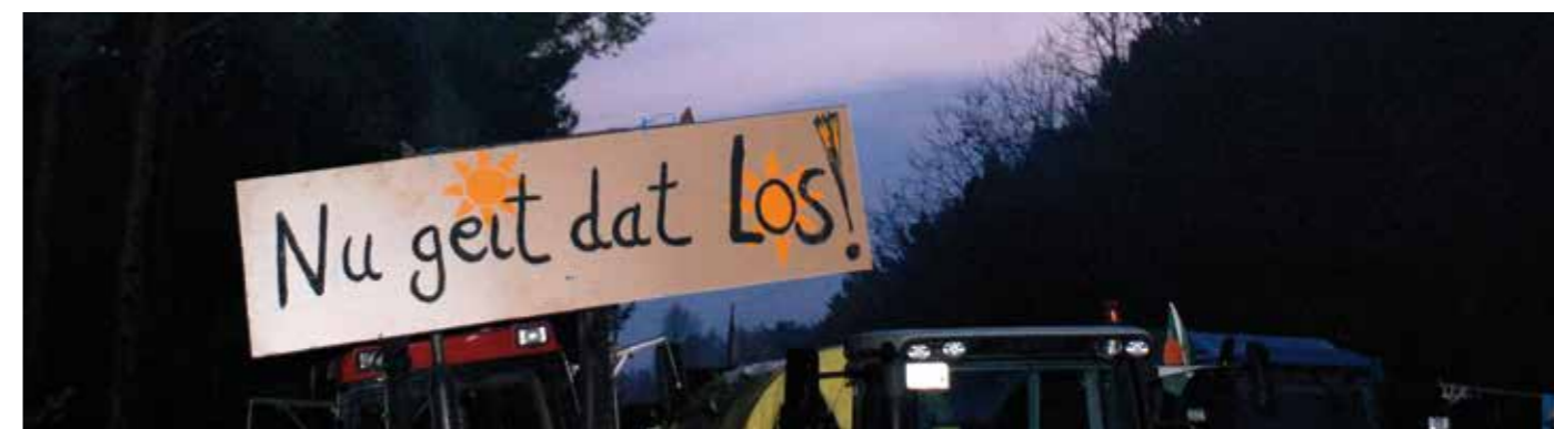
Gorleben, 8.11.2008