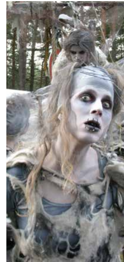
Aktionstheater in Gorleben, 8.11.2008