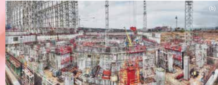
Baustelle des Fusionsreaktor-Experiments ITER im französischen Cadarache

„Sicher, sauber, billig“ lautet die Verheißung der neuen Reaktorkonzepte, die Atomkraft wieder salonfähig machen sollen. Selbst der Präsident des deutschen Atomforums Ralf Güldner forderte unlängst, Deutschland müsse sich auch nach Abschalten des letzten AKW weiter „an der Reaktorentwicklung beteiligen“.