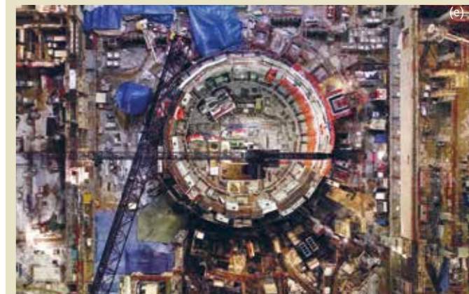
Baustelle des Fusionsreaktor-Experiments ITER

Keine Kernspaltung, sondern eine Kernfusion, betrieben mit Wasserstoffisotopen, die deutlich mehr Energie freisetzt; angeblich ohne Risiko katastrophaler Störfälle; keine extrem langlebigen radioaktiven Folgeprodukte.