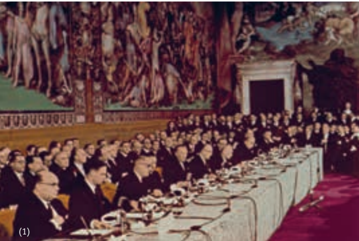
Unterzeichnung des Vertrags zur Gründung der Europäischen Atomgemeinschaft (Euratom) 1957 in Rom

Steinalt, überholt, überflüssig – und immer noch gefährlich wirkmächtig: das ist der Euratom-Vertrag von 1957, der bis heute quasi unverändert gilt. Die „Europäische Atomgemeinschaft“, die er begründete, ist eine parallel zur Europäischen Union (EU) bestehende internationale Organisation. Ihre Organe sind jedoch mit denen der EU identisch. Alle EU-Staaten sind bisher Pflichtmitglieder – unabhängig davon, ob sie Atomkraftwerke betreiben oder nicht.