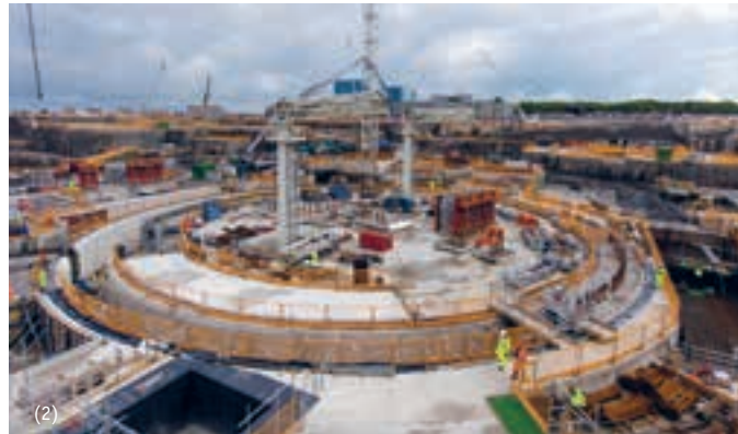
Vorbereitende Baumaßnahmen für das AKW Hinkley Point C