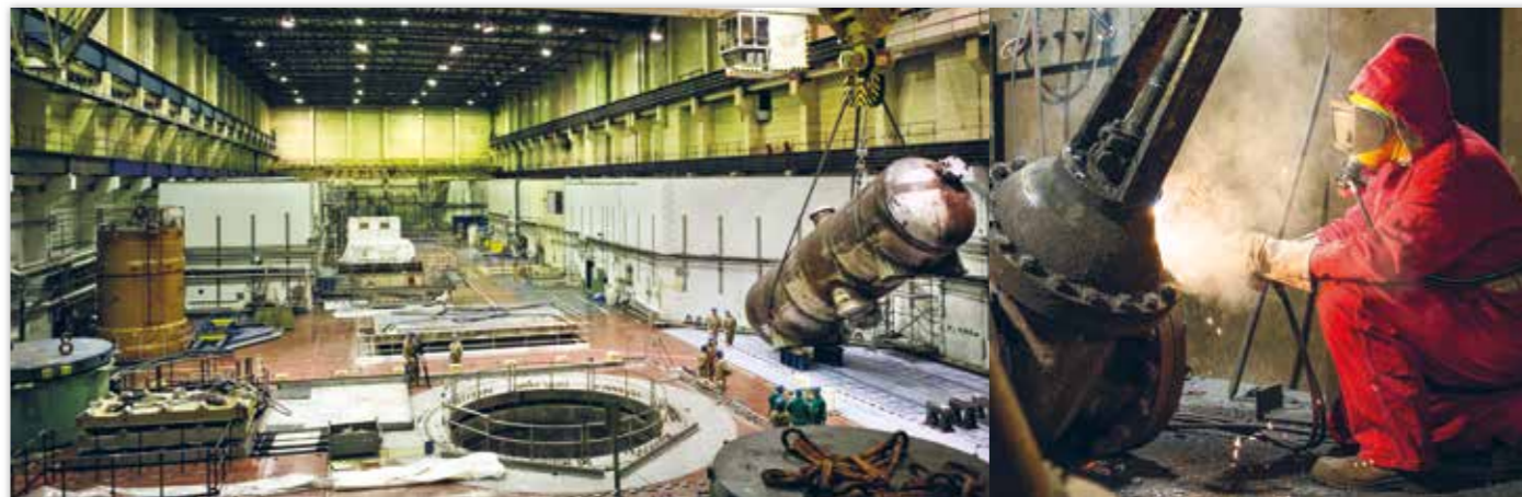
Dekontaminierungsarbeiten in der Reaktorhalle von Greifswald. Rechts im Bild ein Dampferzeuger. Bevor er ins Zwischenlager kommt, wird er zersägt.

Beliebige Grenzwerte, fehleranfälliges Verfahren, mangelhafte Kontrollen